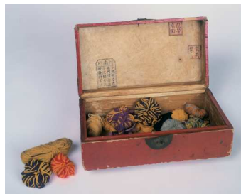
Rekonstruktion des Wollkästchens von Vincent van Gogh Van Gogh Museum, Amsterdam (Vincent van Gogh Foundation)