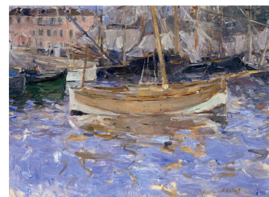
Berthe Morisot Der Hafen von Nizza, 1881/82 Wallraf-Richartz-Museum & Fondation Corboud, Köln