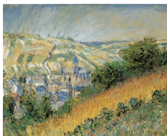
Claude Monet Blick auf Vétheuil, 1881 Albertina, Wien – Sammlung Batliner