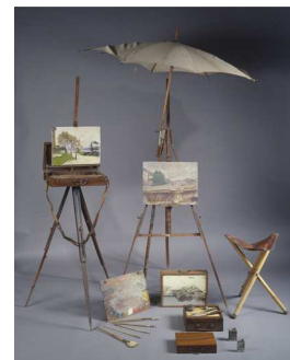
Freilichtmalerei-Ausstattung des Malers Jules-Ernest Renoux, o.J. Petit Palais, Musée des Beaux Arts de la Ville de Paris